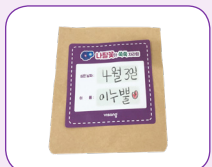
② 낱자와 이름을 쓴 스티커를 팩에 붙인다.