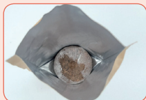
③ 봉투를 펼쳐서 압축토 흠이 위를 향하게 넣어요.