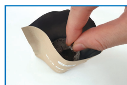
④ 압축토 중앙에 씨앗을 심어요.