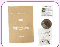
① 압축토와 씨앗을 꺼낸다.