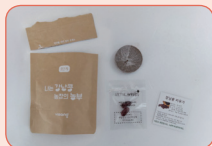
① 봉투의 점선 부분을 잘라 압축토와 강낭콩을 꺼내요.