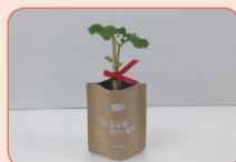
⑤ 강낭콩이 어느 정도 자라면 지지대를 꽂아서 줄기를 고정해요.