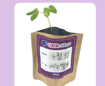
알주일후 새싹이 자라난 모습