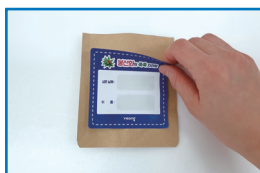
② 스티커에 심은 낱자와 이름을 적고 봉투에 붙여요.