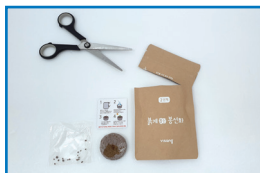
① 봉투를 잘라 내용물을 꺼내요.