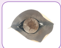
③ 압축토 흠이 위를 향하게 넣고 미지근한 물을 붓는다.