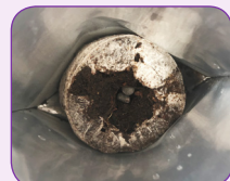
④ 압축토가 부풀면 씨앗을 심는다.