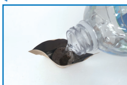
③ 봉투에 압축토를 넣고 물을 부어요.