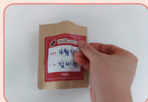
② 스티커에 낱자와 이름을 쓴 후, 봉투에 붙여요.